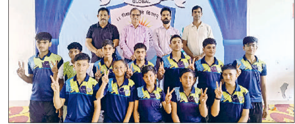
जीद। पदक जीतने वाले विद्यार्थी।