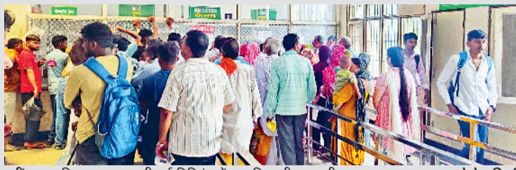
जींद। नागरिक अस्पताल की नई बिल्डिंग में दवा खिड़की पर लगी लाइन।