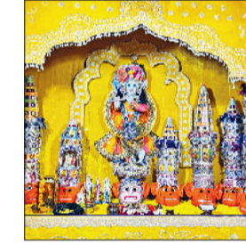
महादेव कॉलोनी सीवन गेट पर स्थापित की प्रतिमा।