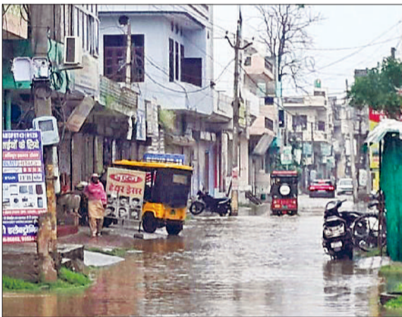
जींद। निकासी न होने से जमा बरसाती पानी।