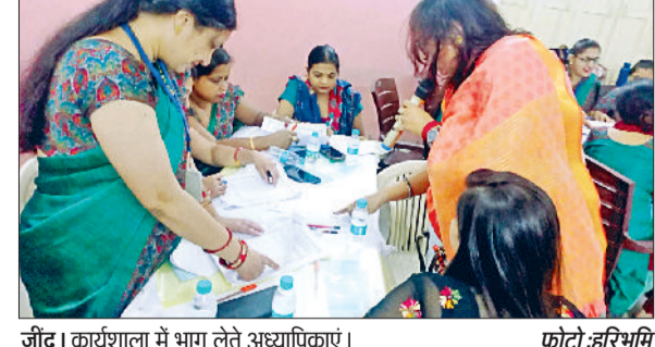
जीद। कार्यशाला में भाग लेते अध्यापिकाएं।