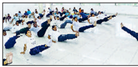
पुलिस लाइन में योगा करते पुलिस के जवान