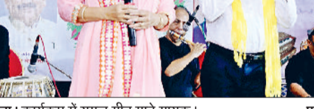
नरवाना। कार्यक्रम में युगल गीत गाते गायक।