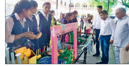
उचाना। शहर के कन्या स्कूल में आयोजित विज्ञान प्रदर्शनी।