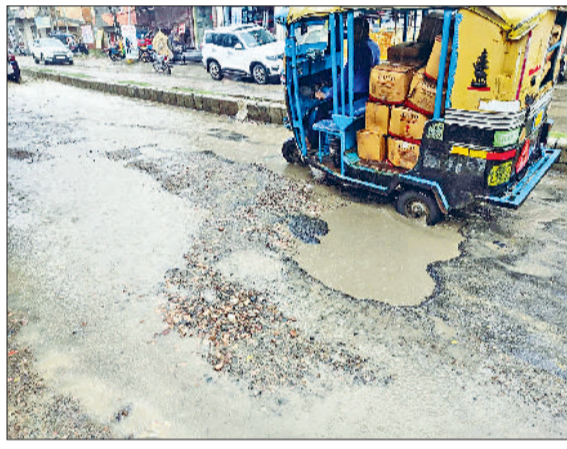
जींद। सड़क पर गड़े में जमा बरसाती पानी से गुजरता ऑटो।