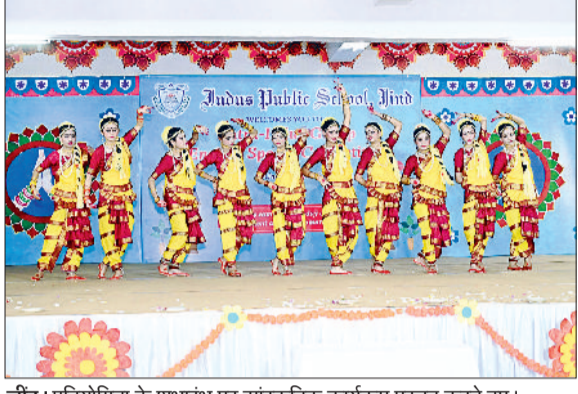
जीद। प्रतियोगिता के शुभारंभ पर सांस्कृतिक कार्यक्रम प्रस्तुत करते हुए।