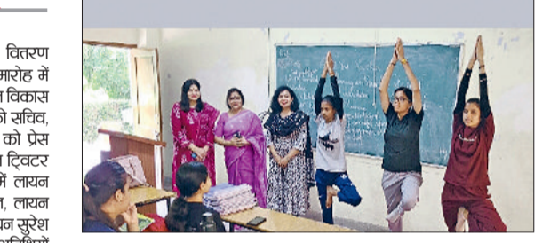
इंटरशिप के दौरान सीखी गई गतिविधियों का निरीक्षण करती प्राचार्य।

उचाना। रजबाहा रोड पर उचाना मंडल के पदाधिकारियों की मीटिंग हुई। मुख्य अतिथि के तौर पर माजपा विधायक देवेन्द्र चतर्भुज अत्री पहुंचे। रविवार को उचाना इलके के सभी चारों मंडलों में अलग-अलग पदाधिकारियों की मीटिंग हुई। यहां पहुंचने पर विधायक का स्वागत किया गया। पत्रकार वार्ता में विधायक ने कहा कि माजपा संगठनात्मक मीटिंग थी। वार्ता में मुख्य विधायक, अलग-अलग मंडलों में मीटिंग हुई है। अब तक केन्द्र प्रदेश सरकार द्वारा कार्य किए गये हैं उनके बारे में बताया गया है ताकि बूथ स्तर पर हर दर जाकर सरकार के ऐतिहासिक कामों को बता सकें। आईएमटी की घोषणा को लेकर विधायक ने कहा कि आईएमटी का आना हमारे लिए आना बहुत बड़ा ऐतिहासिक काम है। आईएमटी को जो उचाना इलके को लेनाका चौम नायब सिंह सेनी ने दिया है इससे बड़ा कोई ऐतिहासिक काम हो नहीं सकता है।