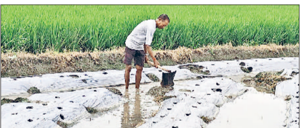
सीवन। खेत से पानी निकलता किसान।

बताया कि बारिश फसलों के लिए फायदेमंद है। अगले 24 घंटों के दौरान आकाश में बादल छाए रहने के साथ बारिश की संभावना है।