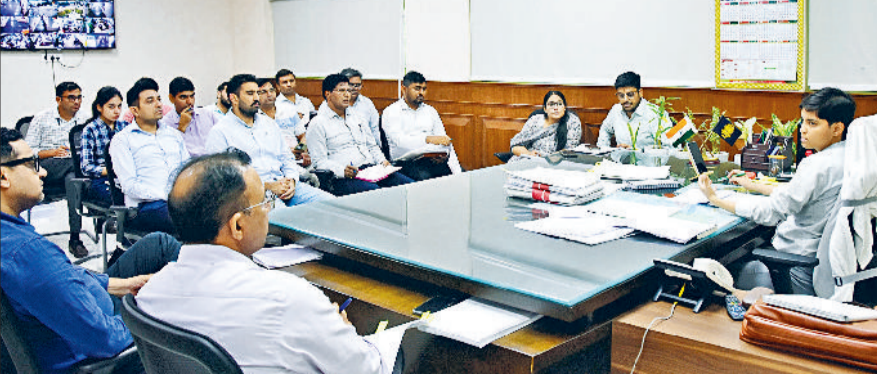
कैथल। डीसी प्रीति अधिकारियों से बातचीत करते।

डीसी प्रीति ने कहा कि 7 नवंबर तक हरियाणा शहर स्वच्छता अभियान चलाया जाएगा। जिसका टैग लाईन हर मोहल्ला, हर गली, हर मकान, स्वच्छ हरियाणा की पहचान है। इस अभियान के तहत जिला में विभिन्न प्रकार की गतिविधियां आयोजित की जाएगी, जिसमें जागरूकता कार्यक्रम, कूड़ा-कचरा प्रबंधन, खाली पड़े प्लांटों से कूड़े का उठान, ग्रीन एंड क्लीन हरियाणा, जल संसाधन की साफ-सफाई, सफाई