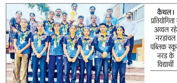
कैथल। प्रतियोगिता में अवल रहे नरडांचल पब्लिक स्कूल नरड के विद्यार्थी